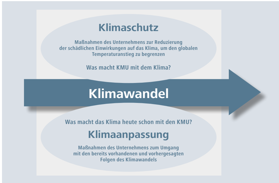
Abbildung 2: Klimaschutz und Klimaanpassung