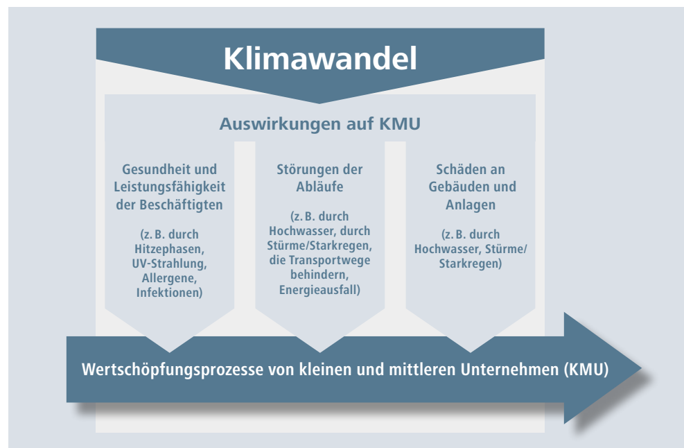
Abbildung 1: Auswirkungen des Klimawandels auf KMU

Um auch in Zukunft markt- und wettbewerbsfähig zu bleiben, ist es zu empfehlen, dass die Betriebe jetzt auf bestehende und prognostizierte klimatische Veränderungen reagieren. Dabei sollten sie zum einen den Klimaschutz und zum anderen die Klimaanpassung berücksichtigen – siehe Abbildung 2. Zum Klimaschutz zählen Maßnahmen des Unternehmens, „die der Erderwärmung und einem damit verbundenen Klimawandel entgegenwirken“ (Springer Gabler, 2024). Es geht vor allem um die Emissionsreduzierung, z. B. um die Reduktion von Kohlenstoffdioxid, das zur globalen Erwärmung beiträgt. Unter Klimaanpassung werden Maßnahmen des Unternehmens zum Umgang mit den bereits bestehenden Auswirkungen des Klimawandels verstanden, sodass man auf die bereits vorhandenen und vorhergesagten Folgen eingestellt ist (vgl. bpb, 2024). Diese Umsetzungshilfe befasst sich mit Maßnahmen zur Klimaanpassung.